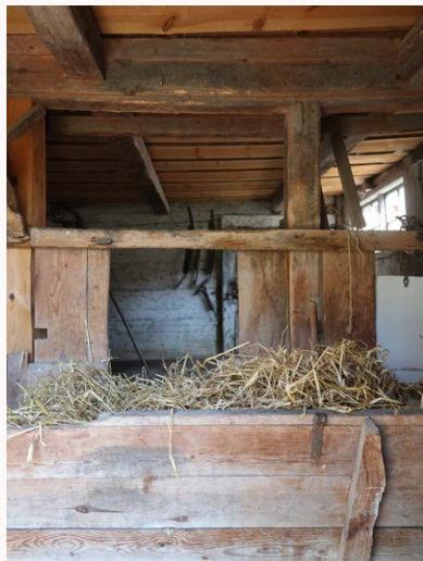
I ladugården fanns det plats för fem kor och en häst.

Intill ladugårdens gavel står dasset, där det finns plats för två vuxna och två barn samtidigt. Genom en smal panelklädd dörr till höger om dasset når man hönsgården. I höns huset ska det förutom höns ha funnits plats för en hushållsgris.