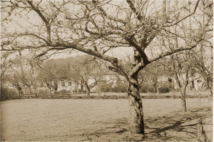
Fotografi taget när den stora fyrkantiga ytan i köksträdgårdens mitt fortfarande användes för odling. Här finns numera en gräsmatta som används av kaféets besökare.

skulle omges av rader med fruktträd och bärbuskar, precis som det är på Krusenstiernska gården. I en lista från von Krusenstiernas tid nämns 20 sorters äpplen, 15 sorters päron och sju sorters plommon.