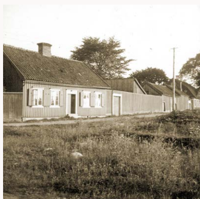
Krusenstiernska gårdens byggnader utmed Stora Dammgatan. Trädgårdsmästarbostaden närmast i bild.