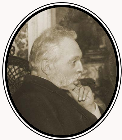
Philip von Krusenstierna (1836–1908).