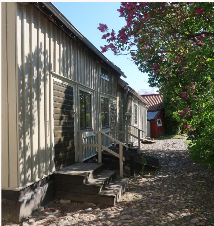
I uthuslängan finns brygghus, drängstuga, vedbod, ladugård, dass och hönshus. Ladan och vagnshuset längst bort i raden har på senare tid inretts till kafé.

I tomtens norra hörn, i korsningen mellan Stora Dammgatan och Kungsgatan, ligger trädgårdsmästARBostaden. Huset är byggt omkring 1870. Stora delar av byggnadsmaterialet ska vara återanvänt från en rivna bryggeribyggnad. Att trädgårdsmästaren fick ett eget bostadshus visar att han hade en viktig roll på gården. TrädgårdsmästARBostaden används idag som kontor av Krusenstiernska gårdens personal.