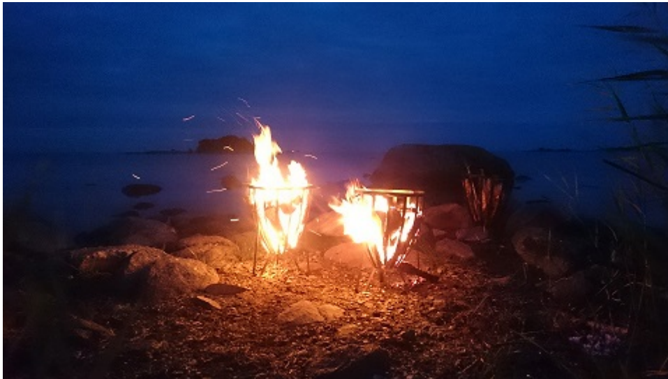
Höstbål, en ny tradition vid Östersjöstranden (Dalkärs badplats)

Deltagande på Ölands vattenråd kunskapskväll med fokus och diskussion runt vatten och att håla vatten.