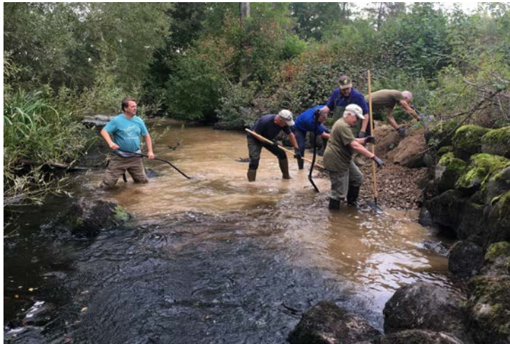
Biotopvårdsarbete vid Hagbyån, augusti 2017