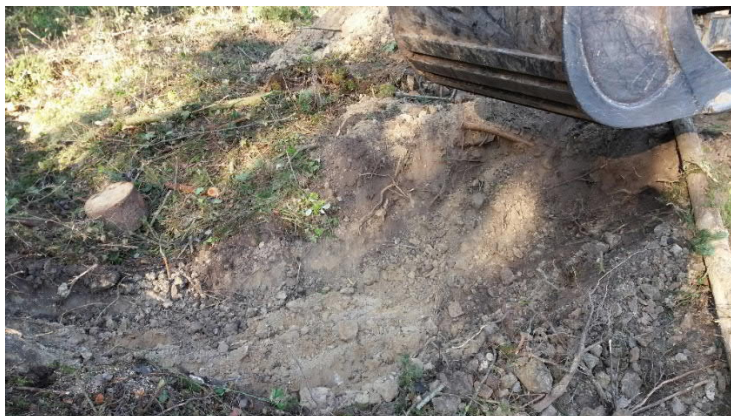
Figur 2 - Kontroll 1