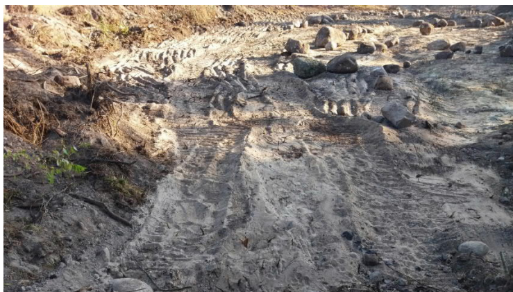
Figur 3 - Kontroll 3

Kontroll 3 utfördes inom ytan för nytt torg. Schaktbotten består i huvudsak av sandig siltig morän och sand. Ställvis förekommer organisk jord och rötter, se figur 3.