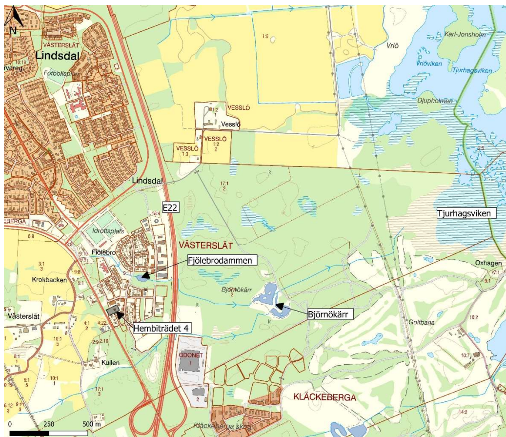
Figur 1 Planområde, berörda dagvattenanläggningar samt recipient.

I nuläget utgörs fastigheten av ett enskilt bostadshus. Resterande del av fastigheten utgörs av naturmark (trädgård). Fastigheten avvattnas mot Fjölebrodammen som har en fördröjande funktion. Dammen anlades i samband med utbyggnad av VA-ledningsnätet inom Fjölebro. Dagvattnet avleds sedan under E22 till den anlagda våtmarken Björnökärr där dagvattnet renas innan utloppet i Tjurhagsviken. Ytvattenförekomsten S n Kalmarsund utgör recipient för planområdet, se figur 1 .